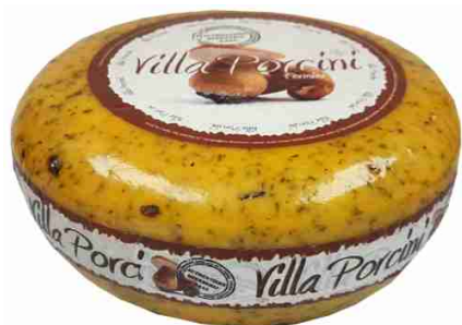
5157 Villa Porcini 50%, ca. 5 kg

holländischer Schnittkäse mit cremiger Konsistenz, verfeinert mit Pilzstücken und Bärlauch 2 Monate gereift