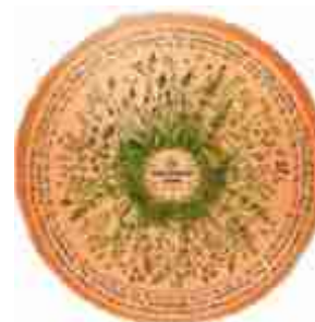
5385 Hochmoorkäse 50%, ca. 6 kg

holländischer Schnittkäse mit cremiger Konsistenz, verfeinert mit Pilzstücken und Bärlauch 2 Monate gereift