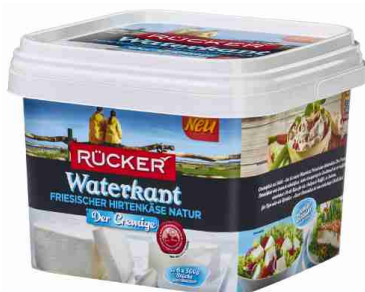
5182 Waterkant friesischer Hirtenkäse der Cremige 40%, ca. 3 kg

Schweizer Halbhartkäse, 6 Monate gereift Die einzigartige Pflanzen- und Kräuterwelt des Ricken Hochmoors, das 800 Meter über dem Meer liegt, ist die Basis für die Hochmoor-Milch, diese führt zu einer speziellen Milchfettzusammensetzung welche ihrerseits für den vollwürzigen, herben Geschmack verantwortlich ist.