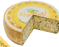
Art. 5628 Rapsody