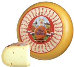
Art. 1505 Belle de Hollande pikante 1/4