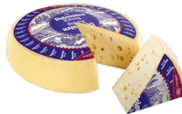
Art. 2126 Dolomitenkönig