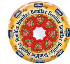
Art. 1220 Bonifaz-Chili