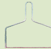
Art. 4968 Werbezugabe

Beim Kauf von Bonifaz-Chili erhalten Sie eine gratis Käseharfe dazu. 1 Torte = 1 Käseharfe