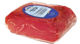
Art. 3177 Mattonella Block