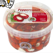
Art. 1638 Peppersweet gef.mit Frischkäse