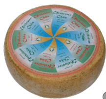
Art. 2625 Urchrüter Chas