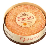
Art. 1572 Germain Epoisses