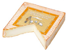
Art. 8032 Brebrousse d'Argental