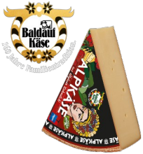
Art. 1376 Baldauf Alpkäse 1/8